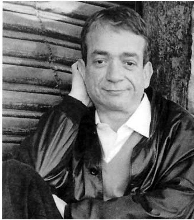
ربيع علم الدين.

أعمال ربيع علم الدين تدرس اليوم في الكثير من الجامعات الأميركية ومنها جامعة نيويورك، اوهايو، كاليفورنيا، وكذلك في الجامعة الأميركية في بيروت. وهي موضع دراسات أكاديمية متخصصة، ويات بحظى بمجهور كبير من القراء الذين يتابعون أعماله. غير ان اسمه ما زال غير مألوف إلى ان يكن مجهولاً تماماً عند القراء العرب. وقد يعود هذا إلى كونه يكتب أولاً بالانكليزية ثم يتطرق إلى شؤون ما زالت تعتبر من المحرمات في المجتمع العربي. وإن كان ربيع علم الدين لبنانياً فهو ولد في الأردن وعاش طفولته مستقلاً بين الأردن والكويت ولبنان، وأضى بعض سنوات الحرب في طوله ثم انتقل إلى الكويت، في السابعة عشر من سافر إلى سان فرانسيسكو وسماحيته وطناً نهائياً في... لكن الرواية في المقابل قد تكون رواية سياسية بامتياز، فهي تتناول لعبة الأحزاب والشخصيات السياسية اللبنانية - والعربية أحياناً - وتفضح بعض ما نسب إليها من الأفعال. صصحح ان Koolaid's تنطرق إلى قضية المثلية وممرض الإيدز تناولاً