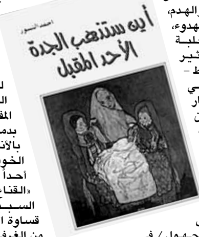
أيه سنتهب الجدة الأخرى أم قبل

/ ما بين ذلك السرير إذ يحده الضيق / وعزّة / الأرواق فوق الطاوله... / وفي اعتراف / أو وصف - لهذه الثنائية التي تحكم الغدب، والمتصلة بدمج أرواق الهو بالأنا لتلا تعرف الخوف الذي يتمك أحداً ما، فصنع عن «القناع، وكيف هو السبيل للتكتم على قسوة الأفتقاد:» أخرج من الغرفة التي لا تحيد / متمثلاً الزائفة على قسماات الوجه المراهق...»