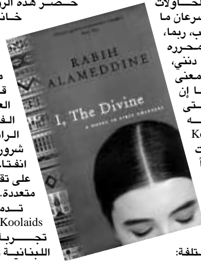
الكتاب الذي كتبه ربيع علم الدين.

تدمج رواية كoolaid's إذا بين تجربة الحرب اللبنانية ووباء الإيدز في الولايات المتحدة الأميركية. فالحرب والمرض وجهان لعملة واحدة. إنهما، كما ينشر علم الدين يجعلان المرء على مقربة من الغناء، ولكن في المرض تستطيع ان نومه أنفسنا باننا نتحكم بحياتنا... بينما هذا يستحيل في الحرب، يقول. ويروي علم الدين بلغة تمكينية وساخرة، حياة أشخاص يعيشون يوماً على المفقرة، مفقرو أزمانهم وحتى مفقرو موتهم. وهذا المفقرو التراخي يفتح علاقة ملتزمة مع الواقع. بل هو يدسر الواقع ويجعله مجموعة من الشظايا. فالكل يرسم واقعهم كما يشاء، والكل يروي الحقيقة كما تستسيغها نفسه. وبالخصص تحوي هذه الرواية طبقات مختلفة من الحقيقة والواقع، وكل هذه الطبقات خاضع لتلقاق الموهن والتغشير، إن كان هناك من قانون وسط هذه الحال المتهاقمة. كان